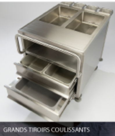
GRANDS TIROIRS COULISSANTS